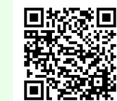
町HPのQRコード (申込用)

申込の際は、「男女共同参画セミナー申込」の旨、氏名、電話番号、お悩みがある場合はその内容を申し出てください。